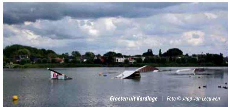
Groeten uit Kardinga