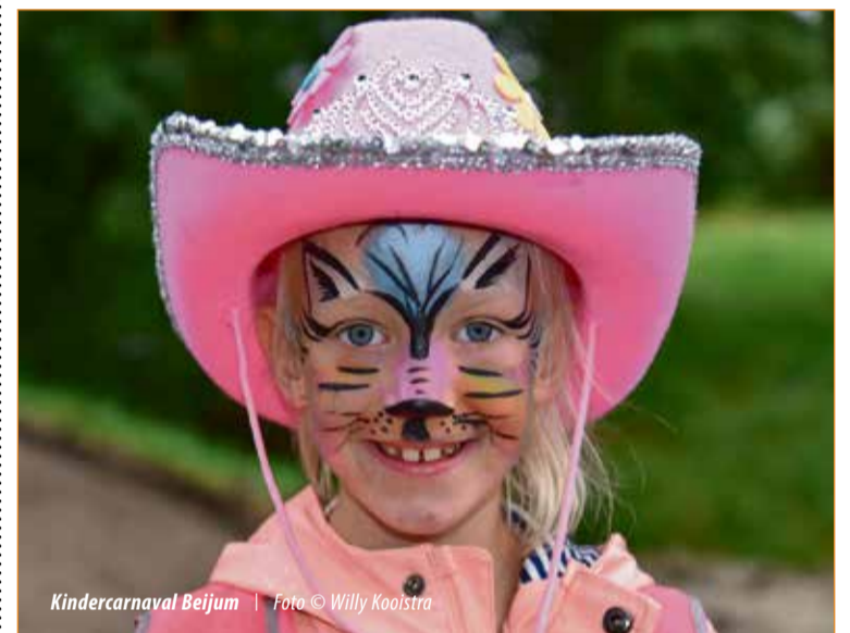
Kindercarnaval Beijum