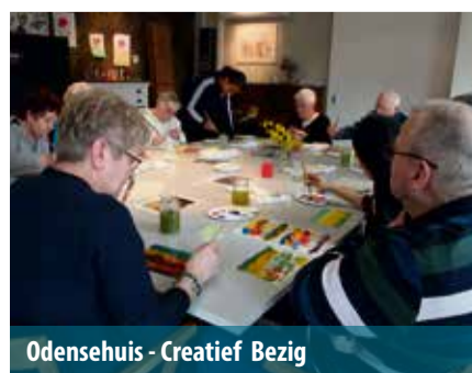
Odensehuis - Creatief Bezig