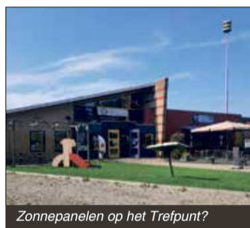
Zonnepanelen op het Trefpunt?

'Bij het Trefpunt staat de aircowel vaak aan, terwijl er geen zonnepanelen op het dak liggen, waarom is dat zo?' vroeg een bewoner zich af. Omdat de huurders zelf de energierekening betalen. Het is lastig om de kosten terug te verdienen, maar er wordt gekeken naar mogelijkheden om toch te verduurzamen. Trefpunt a+ label, zonnepanelen moet huur omhoog, recentelijk dak vervangen.