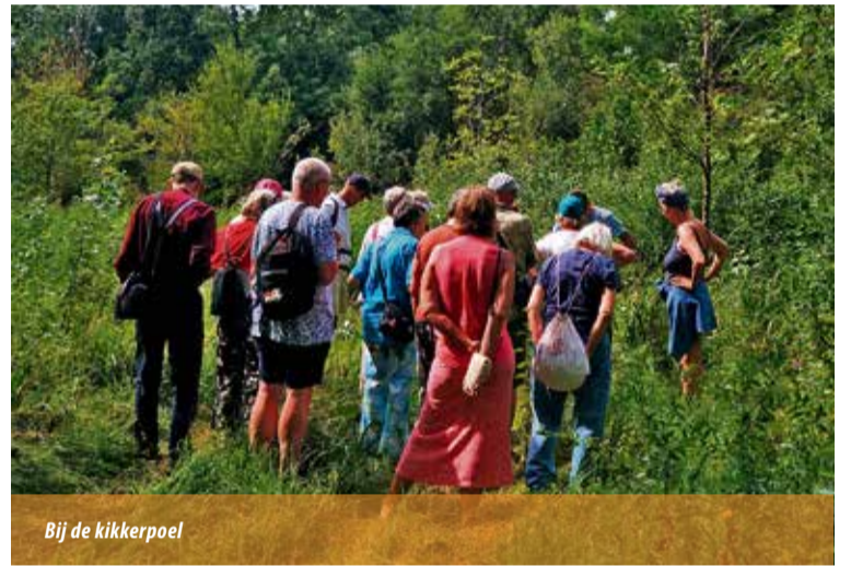
Bij de kikkerpoel