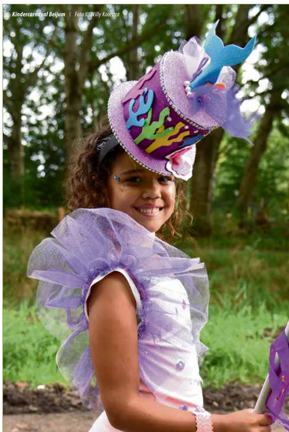
Kindercarnaval Beijum