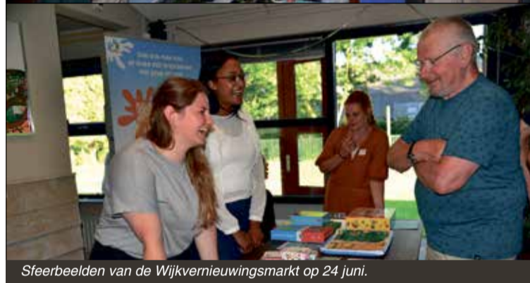
Steerbeelden van de Wijkvernieuwingsmarkt op 24 juni.

Wijkvernieuwing 'Beijum Bruist!' werkt aan een wijk waar iedereen tot zijn recht komt en deelneemt aan de samenleving. Gemeente en woningcorporaties doen dat samen met bewoners, ondernemers en scholen.