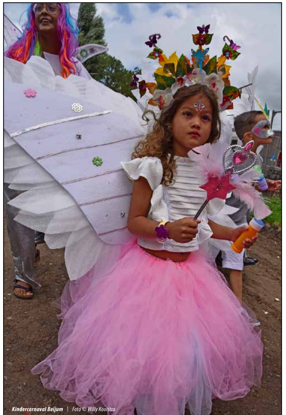
Kindercarnaval Beijum

Vriendelijke groeten, A. Wubbels Bunnemaheerd 48