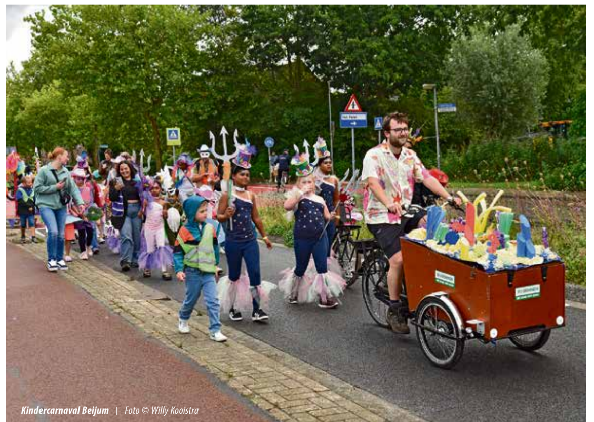
Kindercarnaval Beijum