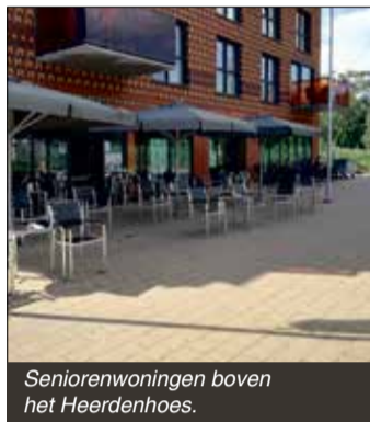
Seniorenwoningen boven het Heerdenhoes.

Tijdens de Wijkvernieuwingsmarkt op 24 juni hebben bewoners verschillende vragen gesteld over de wijkvernieuwing. Zoals over seniorenwoningen, duurzaamheid, biodiversiteit en de bankjes in Onnemaheerd. Op deze pagina geven wij daar een overzicht van.