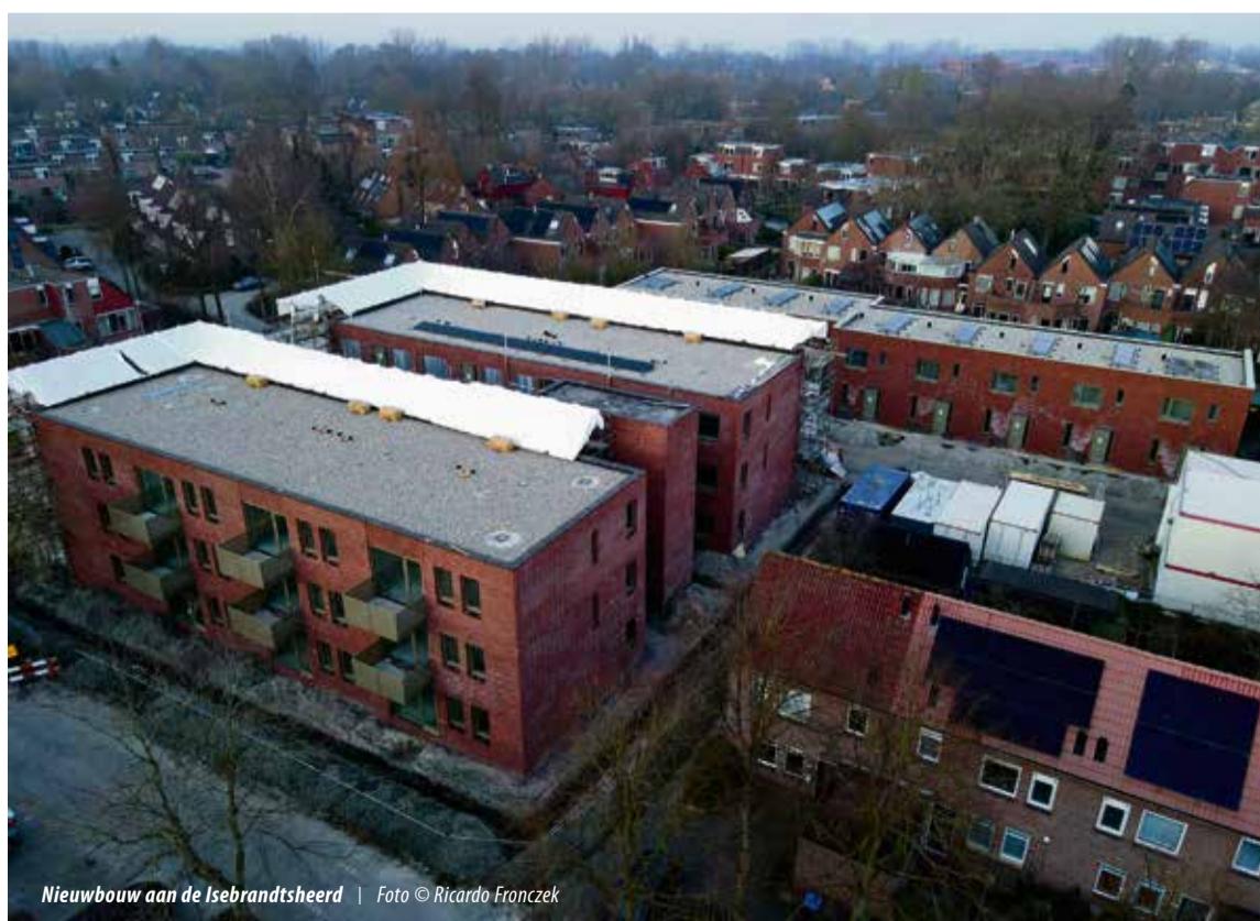
Nieuwbouw aan de Isebrandtsheerd | Foto © Ricardo Franczek

PS: Zie ook het artikel van de Historische Werkgroep op p14