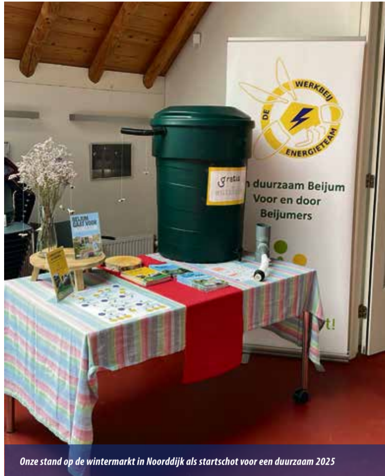
Onze stand op de wintermarkt in Noorddijk als startschot voor een duurzaam 2025

Stuur een mail naar werkbeij@beijum.nl met daarin je adres. We komen bij je langs om de mogelijkheden te bespreken. Vervolgens koop je zelf de ton; wij kopen de materialen om hem aan te sluiten. Als je de ton in huis hebt, komen wij langs om hem te plaatsen. Je betaalt ons alleen voor de materialen die we gebruiken, die €25 tot €30 kosten.