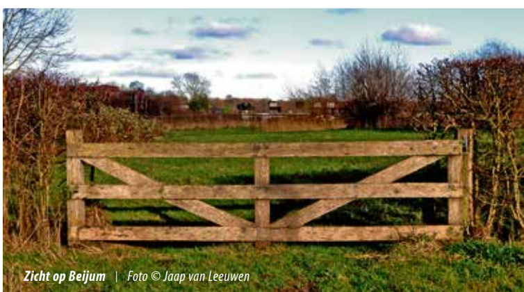
Zicht op Beijum | Foto © Jaap van Leeuwen

De bezorger van De Beijumer doen hun best om de krant correct te bezorgen. Klachten over de bezorging kunt u bij ons melden via tel.nr.: 050-5422807