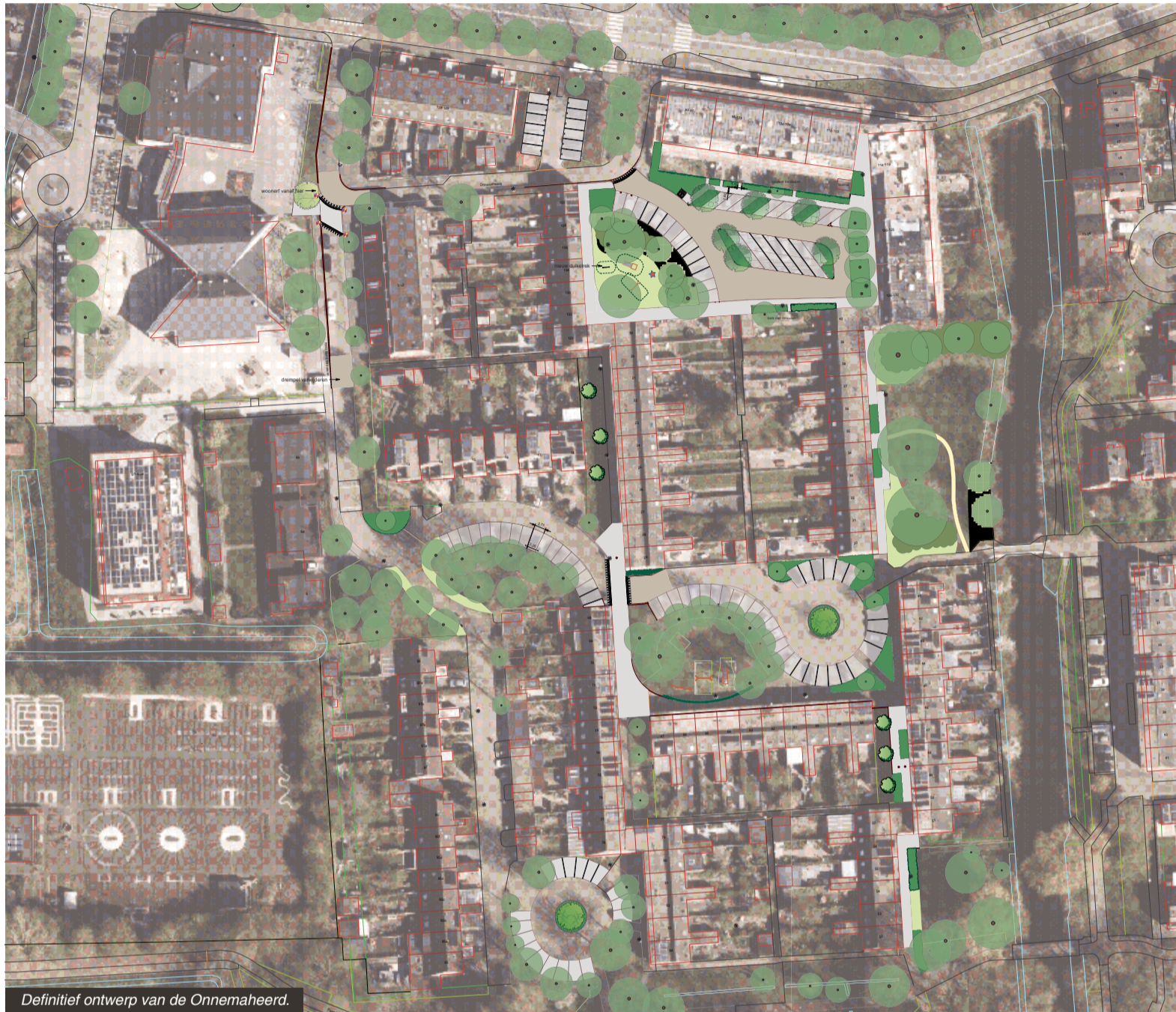
Definitief ontwerp van de Onnemaheerd.