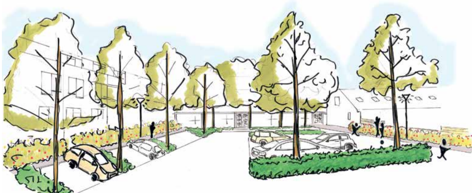
Schetsontwerp van het pleintje.

Nieuwe beplanting In de gehele Onnemaheerd wordt een deel van de beplanting vervangen. Op stenige plek-