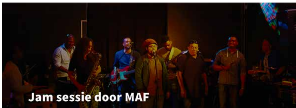
Jam sessie door MAF

van 20.00 tot 24.00 uur. Deze maand op 28 maart.