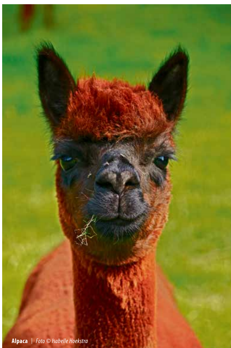
Alpaca